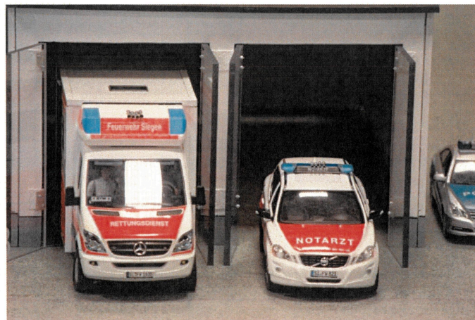
Beinahe wie „echt“ sehen die Modelle aus.