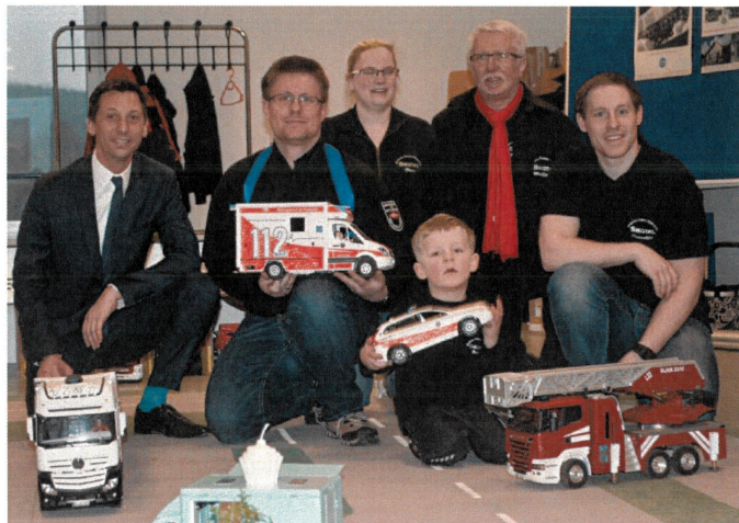
Mittlerweile haben die Modell-Truck-Freunde-Siegtal fast 16.000 Euro an die „Aktion Lichtblicke“ überwiesen.

(wS/red) Netphen-Deuz 15.02.2017 | Seit nun fast 10 Jahren sind die Modell-Truck-Freunde-Siegtal mit ihren fast 40 ferngesteuerten Modellfahrzeugen für den guten Zweck unterwegs. Es fing 2007 recht übersichtlich mit einigen wenigen Modelltrucks an. Familie Barth stellte auf dem Netpher Kreativmarkt damals ihre Fahrzeuge aus, das Publikum war mehr als begeistert. Danach folgte dann der Netpher Weihnachtsmarkt, dort kam immer wieder die Frage auf „Dürfen wir denn auch mal fahren“.