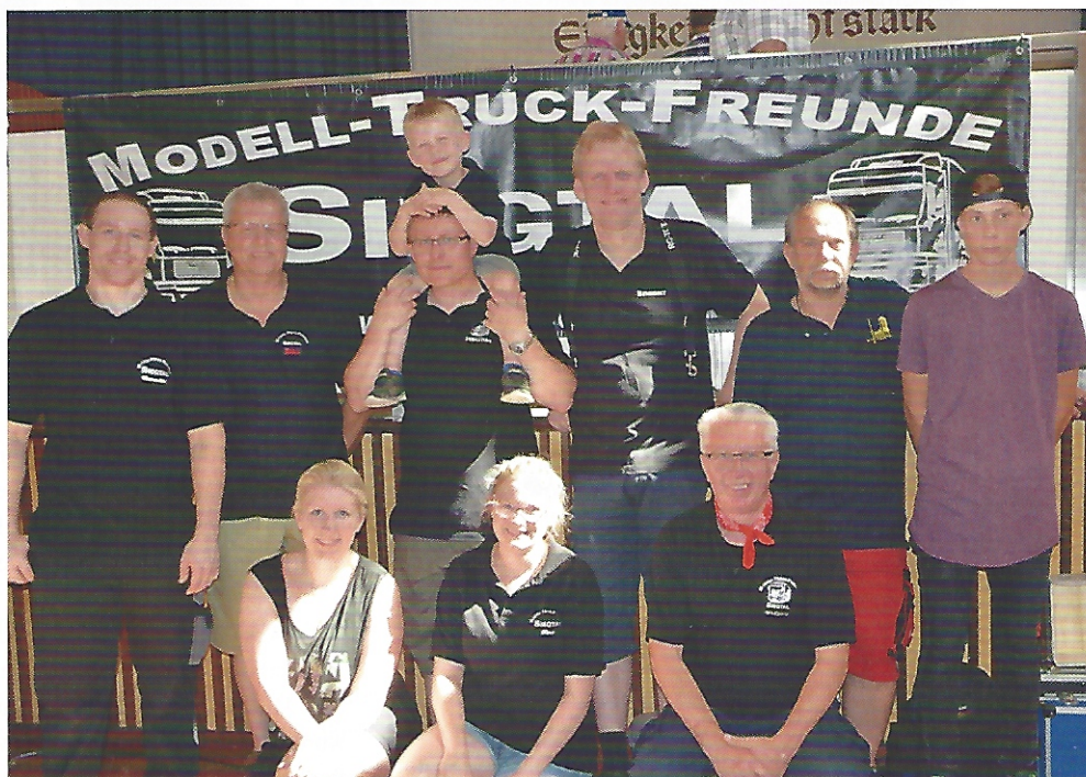
Ein Teil der MTF Siegtal beim diesjährigen Charity-Event