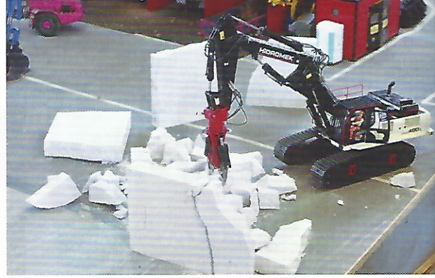
Baustellenfahrzeuge im Einsatz konnten in Netphen-Deuz bewundert werden