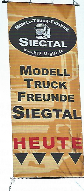
Im Jahr nehmen die Funktionsmodellbauer an rund fünf bis zehn Veranstaltungen teil