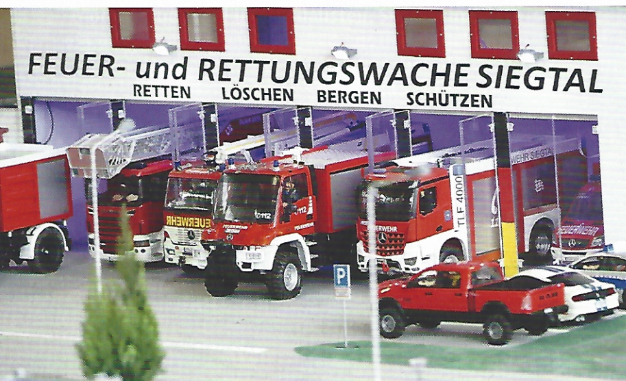
Besondere Feuerwehrfahrzeuge sind einer der Schwerpunkte der Vereinigung

Die Vielfalt und das genaue Nachbauen von Original-Fahrzeugen mit allen Funktionen machen einfach Spaß und sind ein tolles Hobby. Über meine Leidenschaft habe ich schon so viele unvergessliche Erlebnisse gehabt und immer wieder spannende Leute kennengelernt. ■