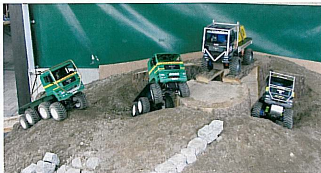
Hier wird im Mini-Format geschuftet

Zusammen mit dem Unternehmen MM Modellbau planen die Modell Truck Freunde Siegtal einen Fahrparcours mit Straßen, Häusern, Lagerhallen und einer Unfallstelle mit Feuerwehreinsatz, wo sie ihre selbstgebauten und ferngesteuerten Modell-Lkw präsentieren. Gegen eine geringe Spende kann jeder hier seinen „Mini-Truck-Führerschein“ ablegen. Auf zwei weiteren Parcours steht harte Arbeit auf der Tagesordnung. Auf einem extra Trial- sowie einem Baggerparcours kommen geländegängige Fahrzeuge sowie hydraulische Baumaschinen zum Einsatz. Weitere Informationen im Internet unter www.mtf-siegtal.de .